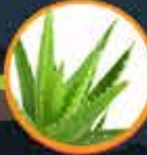
Pokok bunga berkelopak