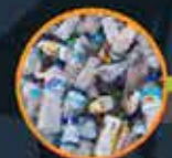
Botol dan tin