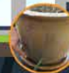
Alas pasu bunga dan pasu bunga