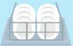
Pelapik rak pinggan