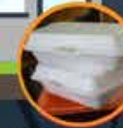
Bekas makan polisterin