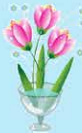
Bekas jambangan bunga