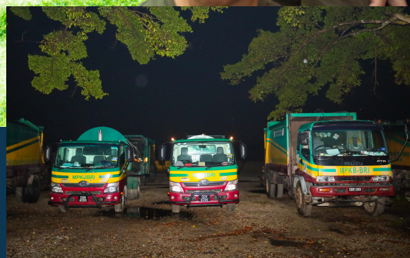
OPS MALAM RAYA