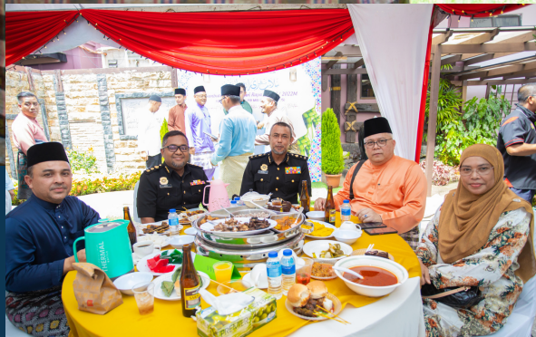
MAJLIS HARI RAYA MPKB-BRI